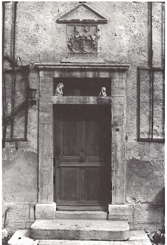
La Cour, Boncourt.