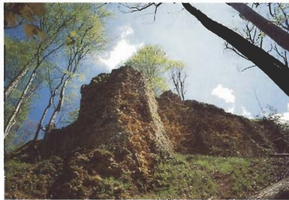
Ruines du château de Montvoie.