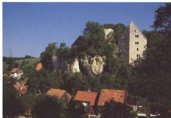
Château de Pleujouse.