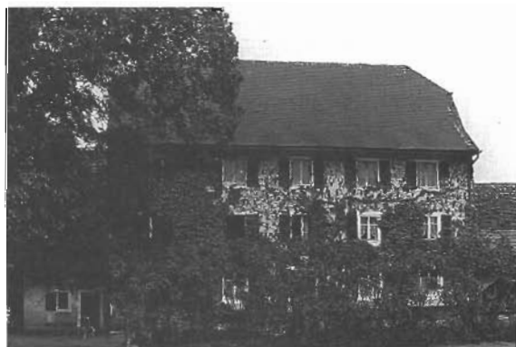
Domaine Hubleur, Alle.