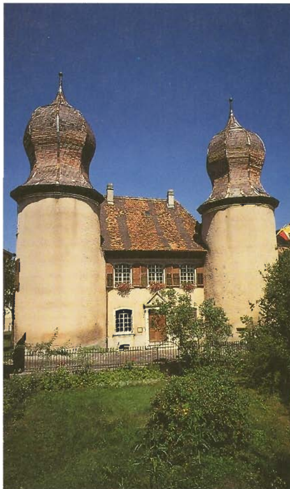
Château de Fontenais.