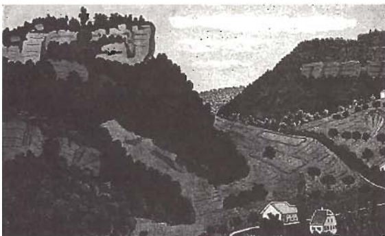
Site du Mont-Terri, Cornol.

Ancienne résidence de la famille de Spechbach, originaire d'Alsace. Ensemble de bâtiments, habitation et rural, formant une cour. A l'est, la partie d'habitation est composée de deux corps abrités par des toits à deux pans. Linteau de porte aux armoiries de Spechbach daté de 1782.